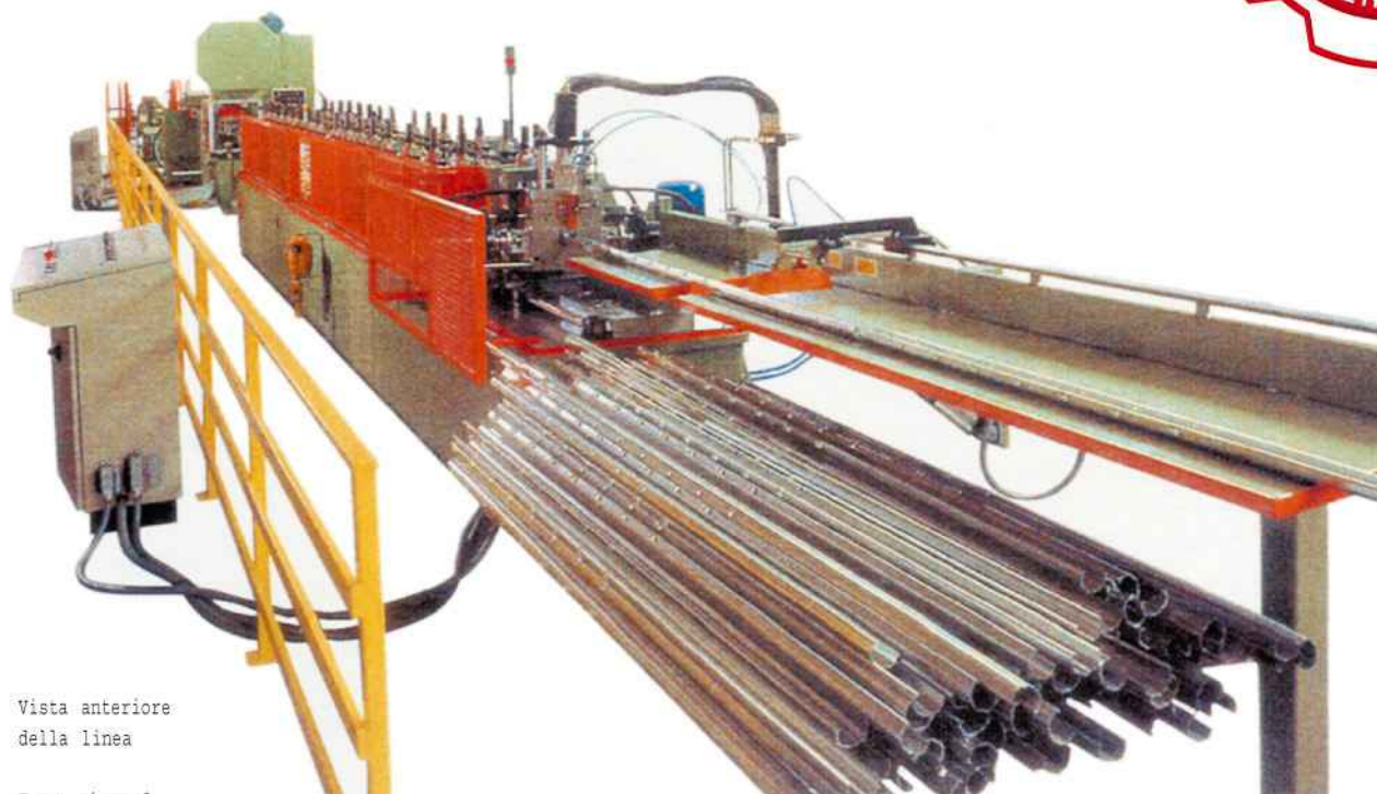
Vista anteriore della linea